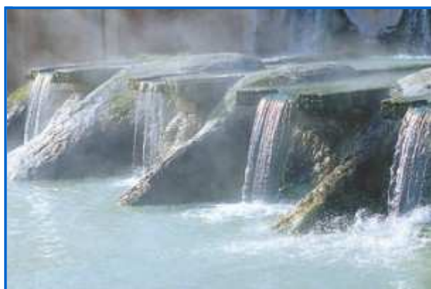
Terme di Suio

Terminiamo il nostro viaggio in provincia di Latina , dove le acque delle Terme di Suio sono sfruttate in 9 diversi stabilimenti, tra cui spicca l'attrezzato Complesso Termale Vescine ( http://www.termevescine.com/ ), dove le cure sanitarie sono unite al relax e alla cura estetica.