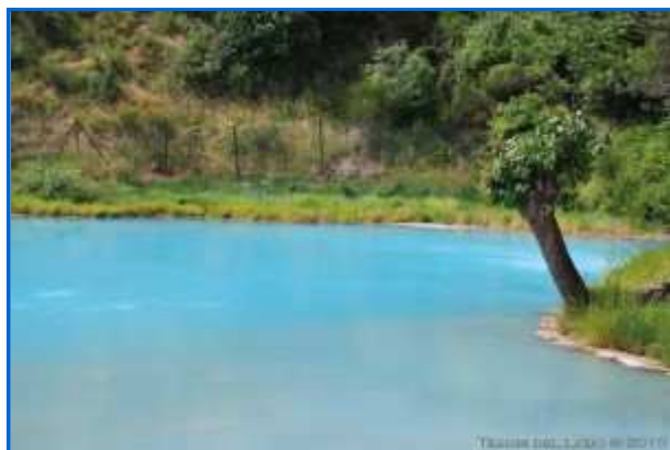
Terme di Cotilia

Le terme di Cotilia si trovano invece in provincia di Rieti , zona ricchissima di falde acquifere; l'attrezzato centro termale a 15 km dalla città sfrutta le proprietà di tre sorgenti ( Vecchi Bagni, Nuovi Bagni e Fonte del Chiosco ), che alimentano naturalmente varie pozze e laghi. ( http://www.regione.lazio.it/rl_turismo/?vw=contenutidettaglio&id=50 )