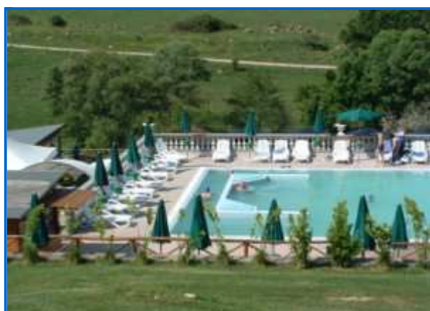
Terme di stigliano